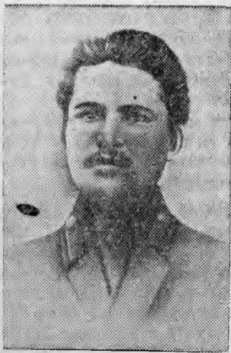
На снимке: С. М. Киров — член Томского комитета РСДРП. 1905 год. (Музей Революции СССР).

Имя Сергея Мироновича Кирова — пламенного, бесстрашного революционера, неутомимого борца за победу социализма, за счастье народа, — никогда не изгладится из памяти миллионов трудящихся нашей страны и всего мира.