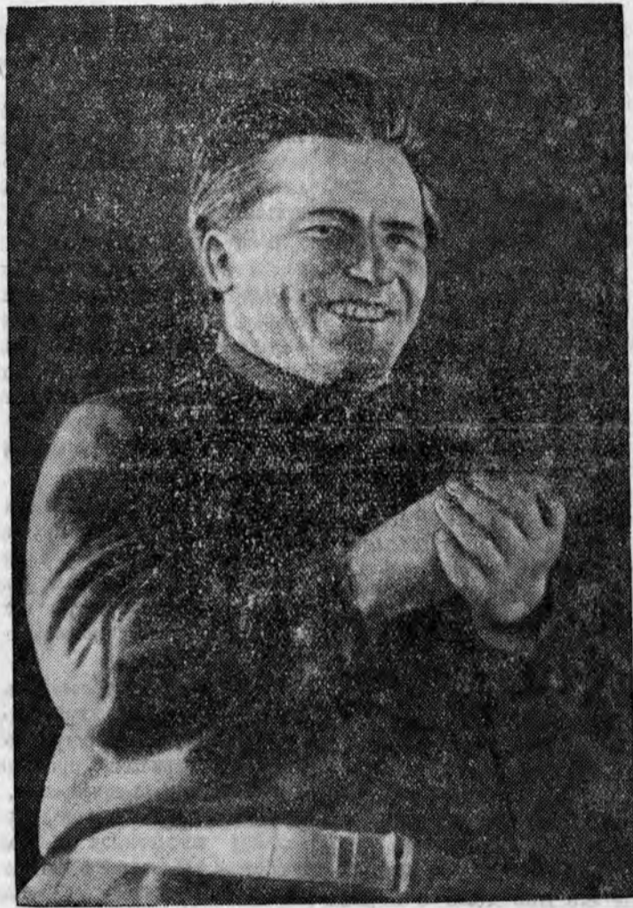
На снимке: С. М. Киров на V-й Ленинградской областной и II-й городской партконференции. (Январь 1934 г.).

Четыре года прошло со дня смерти Сергея Мироновича. В своих речах он говорил: «Не теряйте перед утратами», «Смело, с высоко поднятой головой ити вперед...» Это наше правило, это наш народный обычай. И в годовщину смерти незабвенного народного бойца весь советский народ с удвоенными усилиями продолжает вершить свое великое дело,—дело, которому отдал всю свою жизнь железный коммунист, военачальник, вождь, друг Сталина,—Киров.