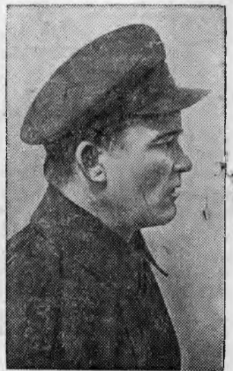
На сн.: Сергей Миронович Киров на строительстве Беломорско-Балтийского канала имени Сталина в июне 1932 года.